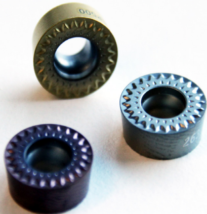
Nouvelle géométrie MF2 pour plaquettes rondes RCMT12